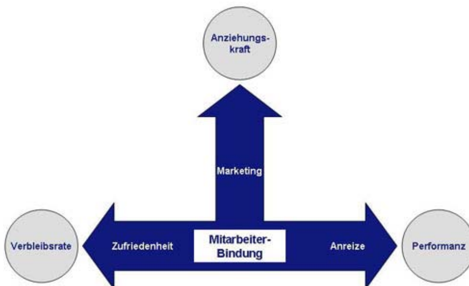
Abbildung 1: Mitarbeiterbindung ist eine entscheidende Voraussetzung für niedrige ungewollte Fluktuation bzw. hohe Verbleibsrate, für starke Anziehungskraft und Arbeitgeberattraktivität sowie für die Steigerung der Performanz des Unternehmens.

Betriebe müssen also den Spagat meistern, Talentträger auch dann bei der Stange zu halten, wenn wirtschaftliche Turbulenzen drohen oder lukrative Beschäftigungsalternativen locken. Überraschend: Dazu muss in aller Regel nicht einmal viel Geld in die Hand genommen werden.